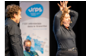
Séquence improvisation avec les comédiens de la troupe Crache Texte .

Dynamisé par la troupe d'improvisation Crache Texte et servi par des interventions remarquables, ce congrès riche en informations, en échanges et en partage d'expérience aura permis aux participants venus de tout le Grand Est de se connecter avec l'avenir de la profession.